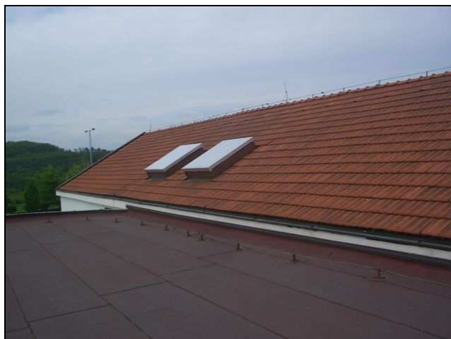
Pohled na část šikmé střechy