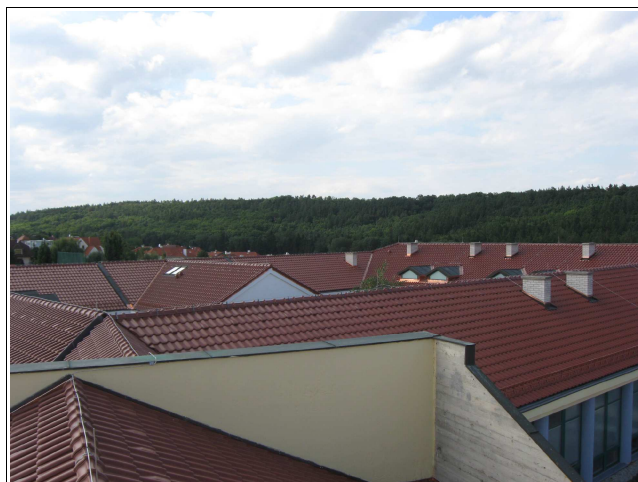
Šikmé střechy po rekonstrukci