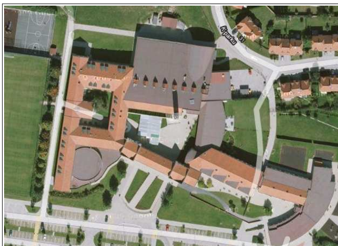
Letecký pohled na areál