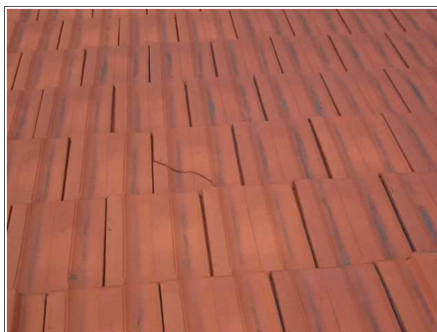
Detaily poškození krytiny